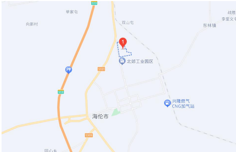
图 1-1 国投生物能源(海伦)有限公司地理位置图